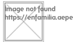
Image not found https://enfamilia.aeped.es/sites/enfamilia.aeped.es/themes/enfamilia/images/enfamilia_log