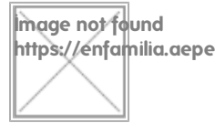
Image not found https://enfamilia.aeped.es/sites/enfamilia.aeped.es/themes/enfamilia_log